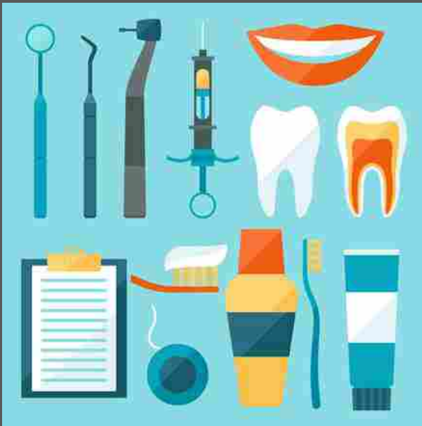
Il decalogo 'salva-denti', 4 minuti con lo spazzolino

Spazzolarli per almeno 4 minuti perché i due canonici non bastano, via libera al test-spia delle gengive che con una sonda speciale riesce a fare la diagnosi in appena 5 minuti. Promossi scovolini e spazzolini elettrici da preferire a quelli manuali e al filo interdentale perché più efficaci nel rimuovere la placca. Semaforo verde anche per i colluttori ma solo dietro consiglio del dentista. Prevenzione e diagnosi precoce consentirebbero di risparmiare ogni anno quasi un miliardo di euro. Sono i contenuti delle prime linee guida mondiali sulla prevenzione, la diagnosi e la cura delle malattie parodontali, promosse dalla Società Italiana di Parodontologia e Implantologia (SIdP) insieme alla European Federation of Periodontology (EFP) , l' American Academy of Periodontology (AAP) e l' Asian Pacific Society of Periodontology (APSP) .