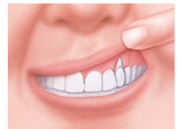
La retrazione del margine gengivale lascia scoperta la dentina e provoca sensibilità