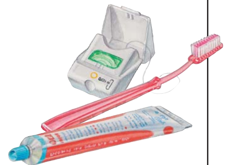
Per scegliere il dentifricio più adatto è meglio farsi consigliare dal dentista