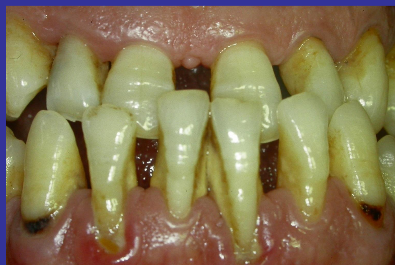
PAZIENTE 2 Prima visita