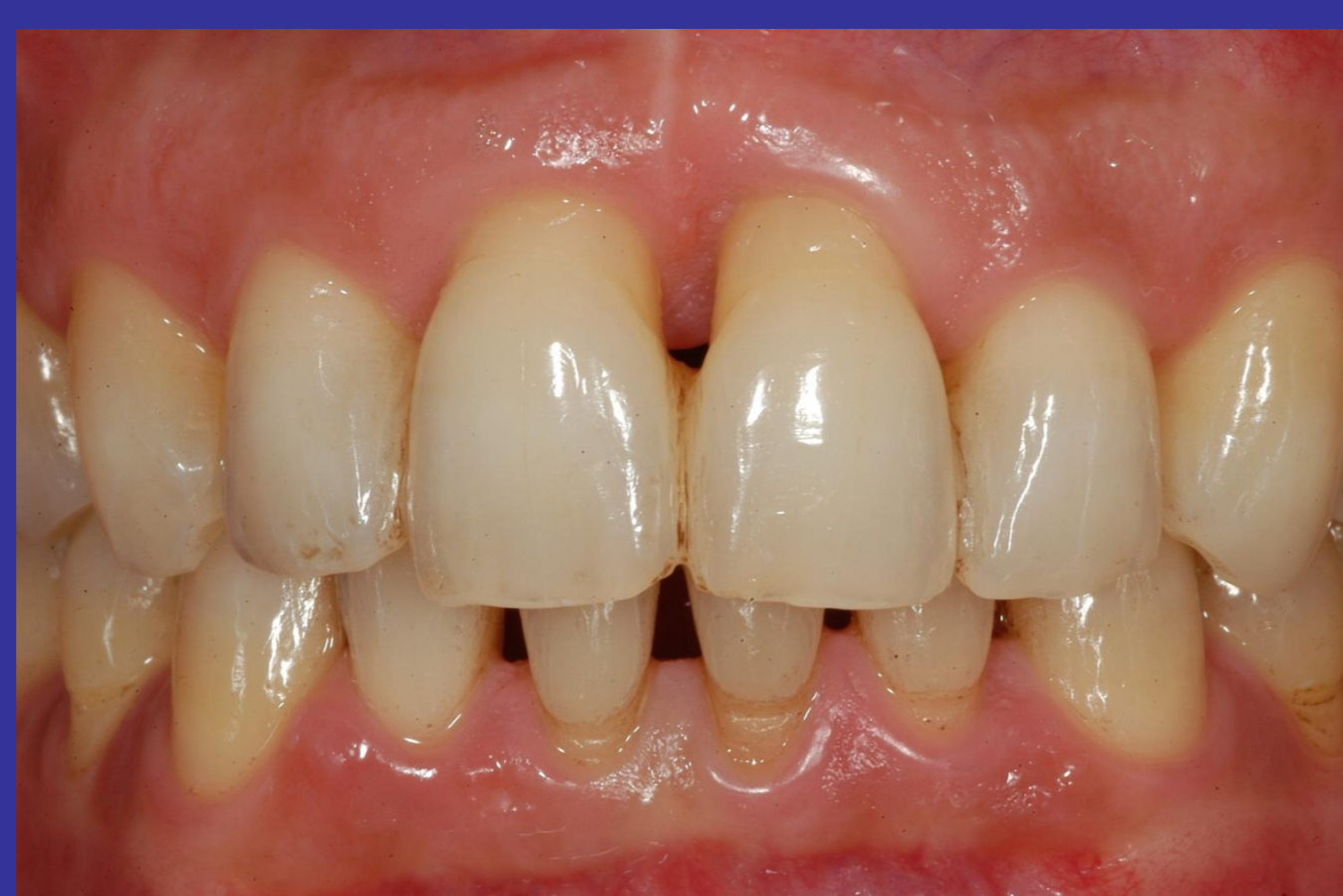
PAZIENTE 1 Dopo terapia parodontale