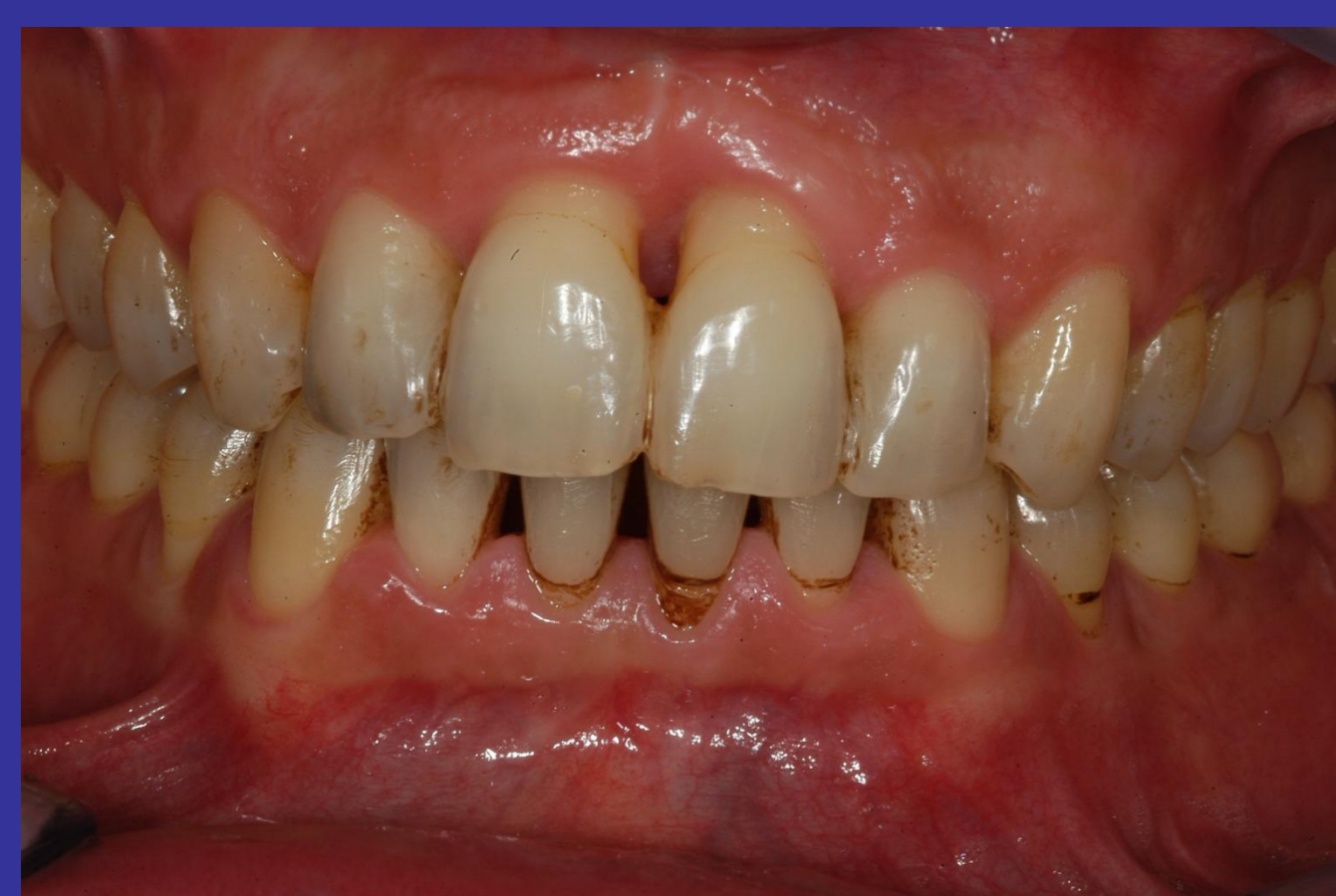
PAZIENTE 1 Prima visita

Delle persone che inizialmente hanno accettato di partecipare allo studio, quattro hanno cambiato idea, lasciandone 77 per la valutazione. Ventuno (su 77) non hanno fumato per un periodo minimo di sei mesi. Nove hanno smesso per meno di sei mesi. Trenta hanno ridotto significativamente il numero giornaliero di sigarette da 16,7±7,5 a 7,4±4,5 (P<0,05). Tredici non hanno modificato le loro abitudini, mentre quattro hanno aumentato il numero di sigarette.