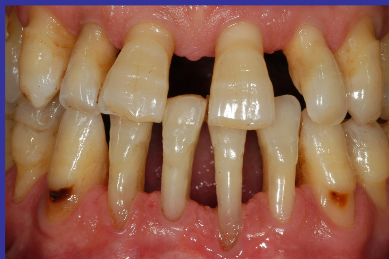
PAZIENTE 2 Dopo terapia orto-perio