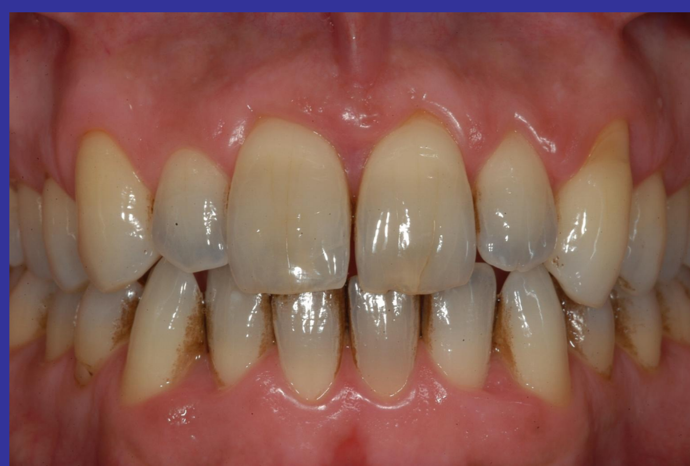
PAZIENTE 3 Nessun cambiamento di abitudini